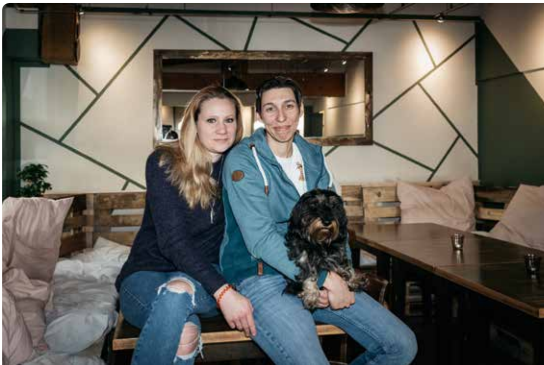
K-Manns im Kulturzentrum Bahnhof Langendreer Wallbaumweg 108 44894 Bochum