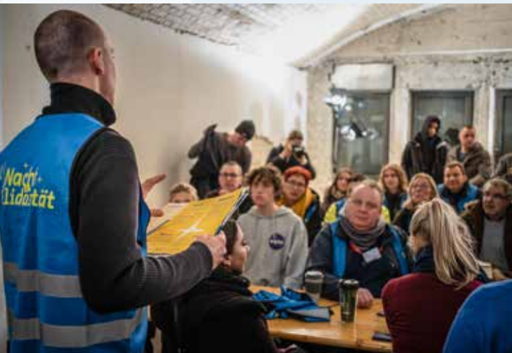
In der City-Station der Stadtmission werden in der „Nacht der Solidarität“ vier der mehr als 600 Zählteams noch einmal instruiert.

Mit diesem Unwissen will die Berliner Landesregierung aufräumen. Statt zu schätzen, sollen die Obdachlosen gezählt und befragt werden. Die internationalen Vorbilder sind Städte wie New York und Paris. Eine erste deutsche Stichtagszählung hatte es im vergangenen Jahr in Dortmund gegeben.