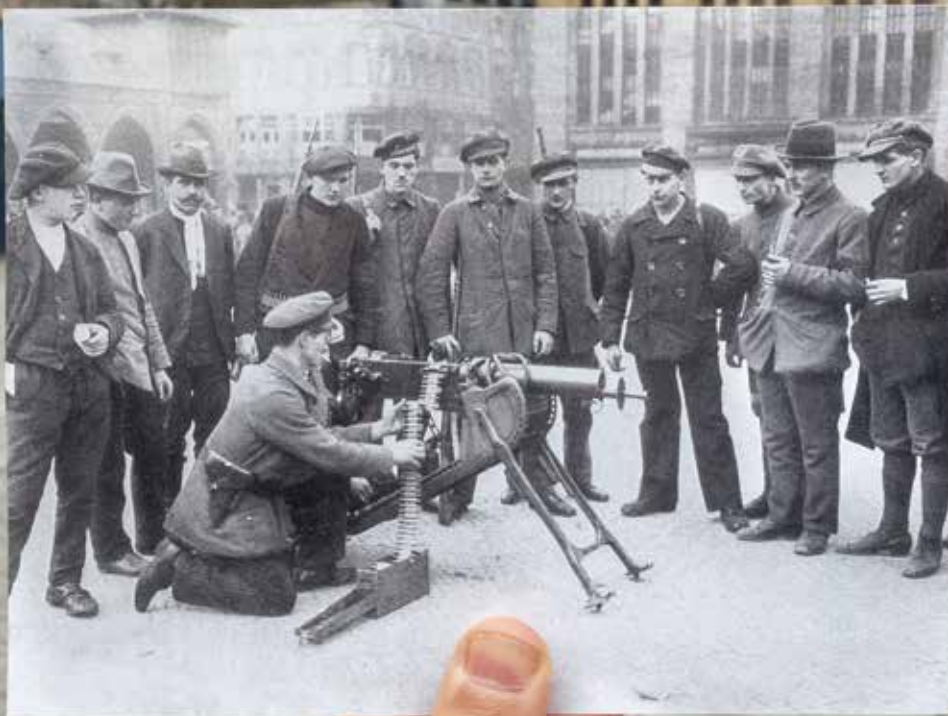
Unten: Rotarmisten auf dem Hansaplatz.